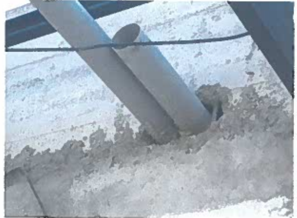
Fotos N° 1 – 2 Detalle de muro de hormigón armado construido en el pasillo del tercer piso: