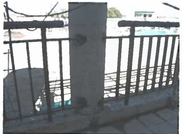
Fotos N° 3 – 4 Encuentro de las barandas del pasillo del segundo y tercer piso con los pilares de hormigón.

Proyecto: "Construcción red interior de agua potable rural para las comunidades de El Maitén, Rinconada Lo vial y Santa Elena, comuna de Maipú"