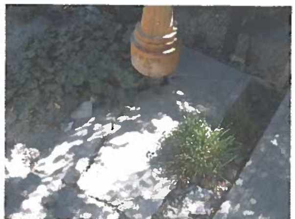
Fotos N° 5 y 6 – Proyecto Rinconada Lo Vial, la losa del grifo está quebrada

Handwritten signature or initials in blue ink.